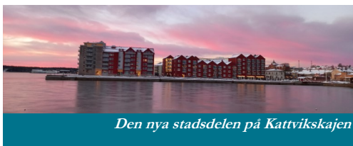
Den nya stadsdelen på Kattvikskajen

Idag finns ingen hamnverksamhet eller såg längre och hamnområdet är just nu i en utvecklingsfas där bostäder, kontor och andra verksamheter både har byggts och fler planeras att byggas. Stadsdelen kommer på sikt att bli en naturlig förlängning av stadskärnan.