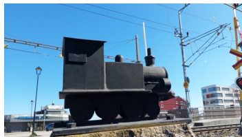
Skulptur av loket Bergsjökoa som trafikerade sträckan Hudiksvall—Bergsjö till 1963

För att få ett effektivt utvecklingsarbete behövde vi hitta vårt lok.