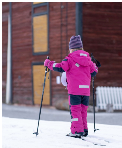
Barnens Vasalopp på Möljen